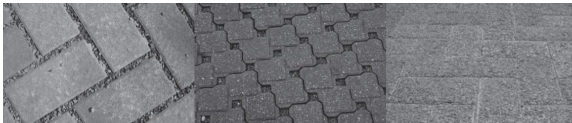
Figura 1 - Revestimentos de pavimento intertravado permeável.

Além das conceituações, a NBR 16.416 de 2015 apresenta três tipologias de revestimentos para pavimentação permeável: pavimento intertravado permeável (Figura 1), placas de concreto permeável (Figura 2) e concreto permeável (Figura 3).