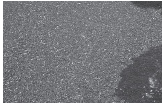
Figura 3 – Revestimentos de pavimento de concreto permeável.