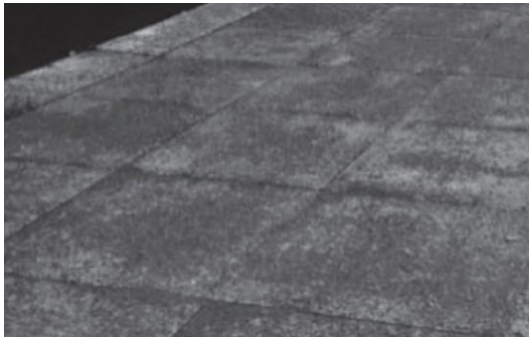
Figura 2 – Revestimentos de pavimento de placas de concreto permeável.