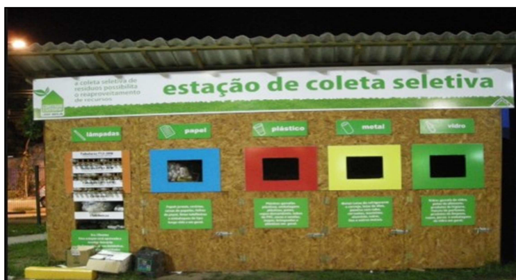
Figura 5: Estação de coleta seletiva da loja Leroy Merlin em Niterói – RJ

Além disso, o presente estudo propõe também a utilização de um sistema para a separação de cada tipo de resíduo reciclável descartado, onde será proposto a instalação de estações de coleta seletiva em determinados pontos das ruas Independência, Santa Catarina e João Pires com identificação de cada resíduo, similares as utilizadas na loja da Leroy Merlin em Niterói – RJ, como ilustra a Figura 5.