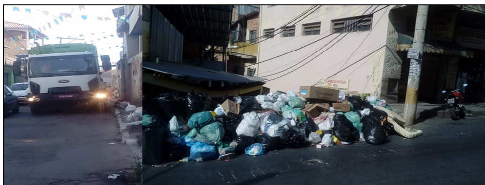
Figura 3 - Rua Independência no Bairro Cabana do Pai Tomáz

A Figura 3 mostra o descarte de resíduos sólidos na Rua Independência, devido a sua infraestrutura possibilitar melhor locomoção dos veículos coletores e para a realização da coleta no bairro por parte da Prefeitura de Belo Horizonte.