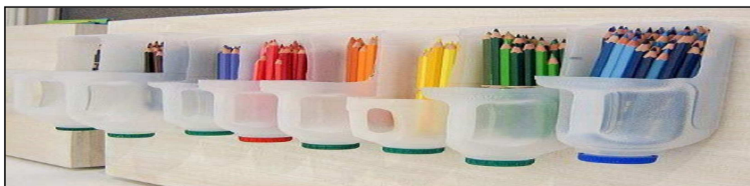
Figura 1: Produtos reciclados

Para Alves (2007), o processo de reciclagem propicia vantagens como a agregação de materiais que antes não possuíam uma destinação adequada, passando assim a ter valor econômico considerável. Porém, existem algumas dificuldades geradas pela falta de critérios de funcionamento, ligados a determinadas técnicas que podem ser observadas em alguns municípios do país. Os processos de reciclagem podem ser para fins educativos ou artesanais (Figura 1).