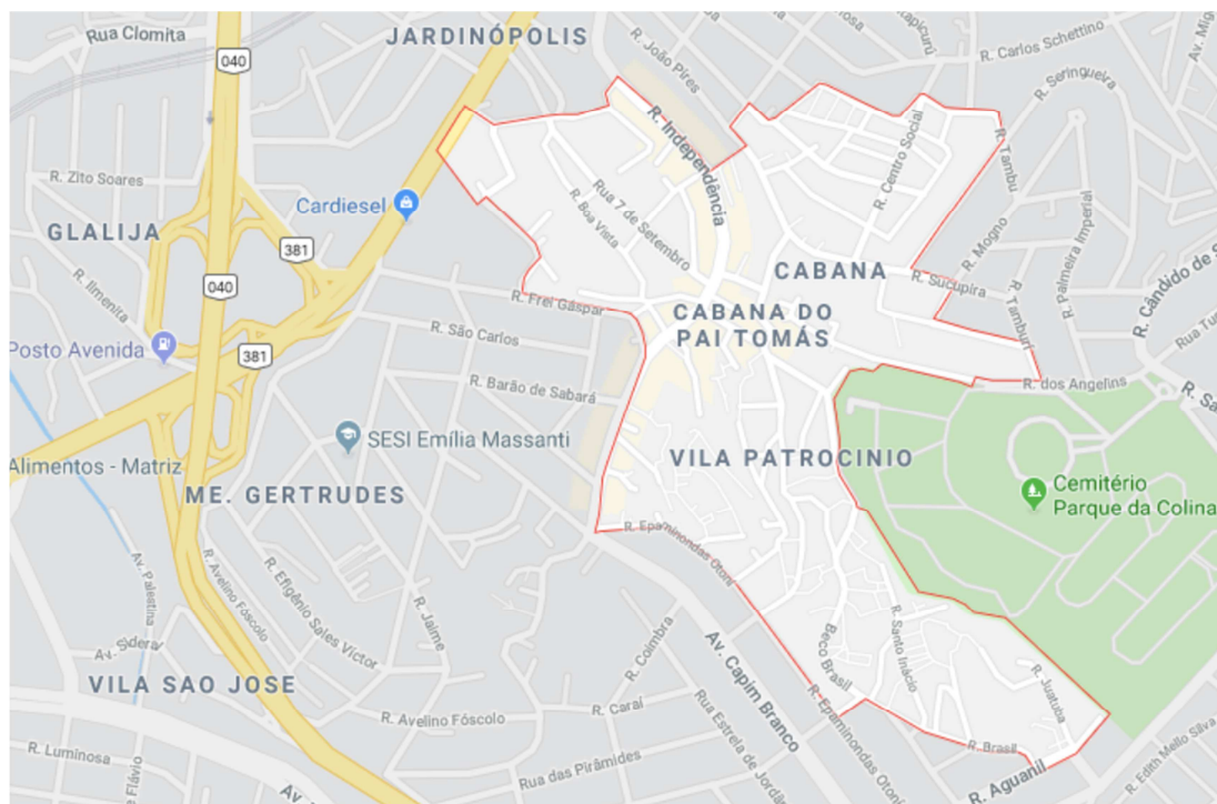
Figura 2- Localização do Bairro Cabana do Pai Tomáz, Belo Horizonte – MG