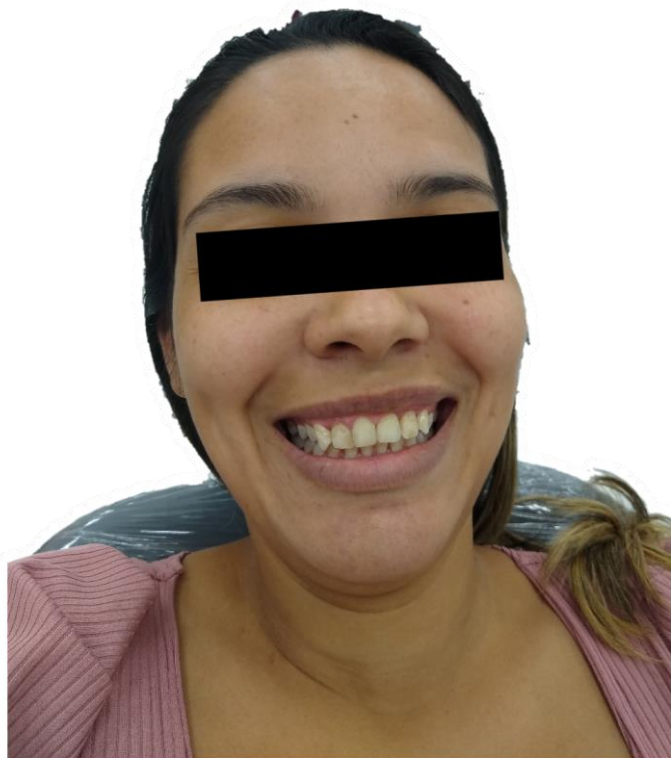
Figura 6 – Resultado final

Paciente foi encaminhada para o tratamento endodôntico dos dentes 12 e 37, a mesma agora segue em estágio de acompanhamento, a mesma apresentou satisfação nos resultados obtidos em função do restabelecimento da estética, e disse “Não sorria mostrando os dentes para as fotos e agora já posso me sentir melhor, não quero para ser atendida por vocês”.