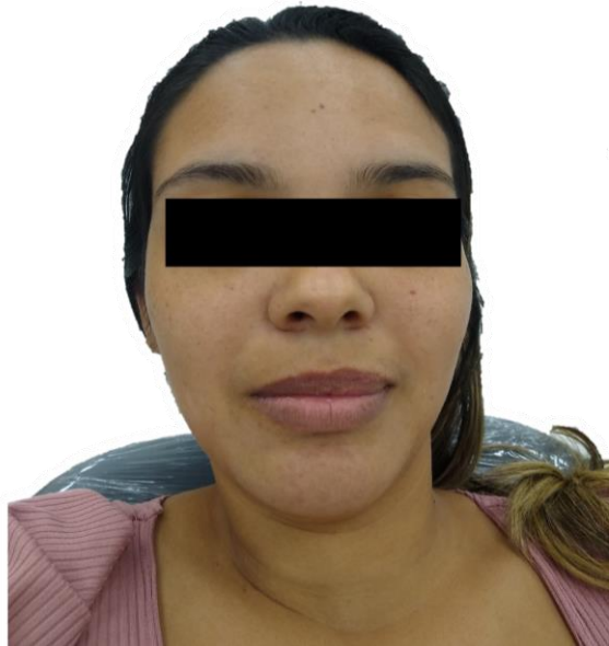
Figura 1 - Perfil facial da paciente

3