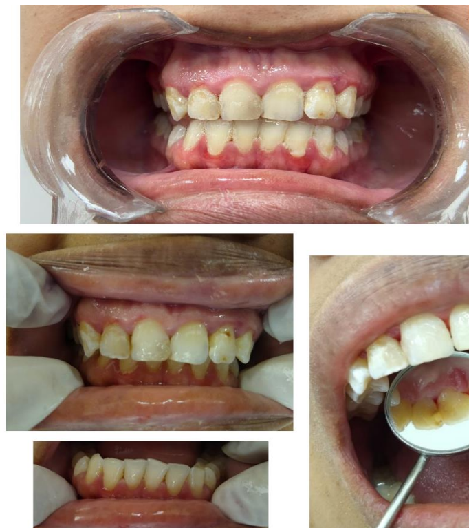
Figura 3 - Cavidade oral da paciente

Fotos da cavidade oral da paciente quando chegou ao primeiro atendimento: