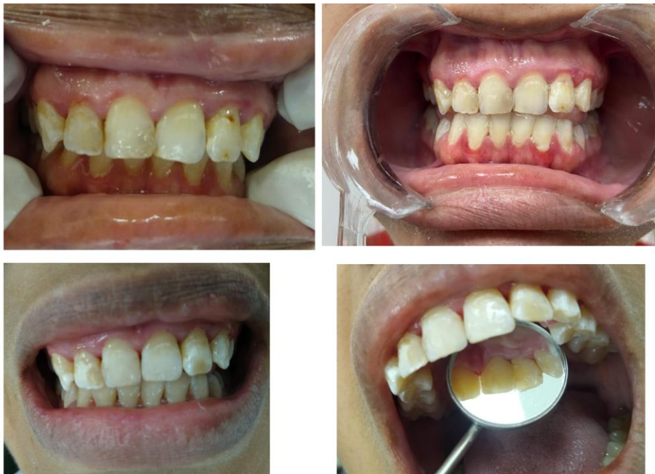
Figura 4 - Fotos mostrando a aparência do antes e depois das restaurações realizadas

em dentina, secagem do esmalte com jato de ar e a dentina com papel absorvente, completamos com o sistema adesivo universal sendo utilizado duas camadas sendo friccionado e jogando o jato de ar para o espalhamento, deixando evaporar o solvente e logo em seguida repeti o processo e fotoativar por 20 segundos, já a reconstrução da anatomia dos dentes foram utilizadas as resinas compostas Llis DA2, Opallis EA1 e Forma translúcida, sendo aplicadas com incrementos pequenos para melhor adaptação e fotoativação de 20 segundos cada incremento, para o acabamento e polimento utilizamos a broca 2135FF, discos abrasivos e as taças de borrachas seguindo a necessidade de cada dente.